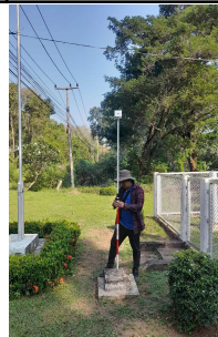
หมุดBMN.12 อุทก02 HYD 2 RID อยู่หน้าบ้านพัก หน่วย N.12A หลังเสาธงชาติ เป็นแท่นปูนสี่เหลี่ยม มีหมุดเหล็กตรงกลางแท่น